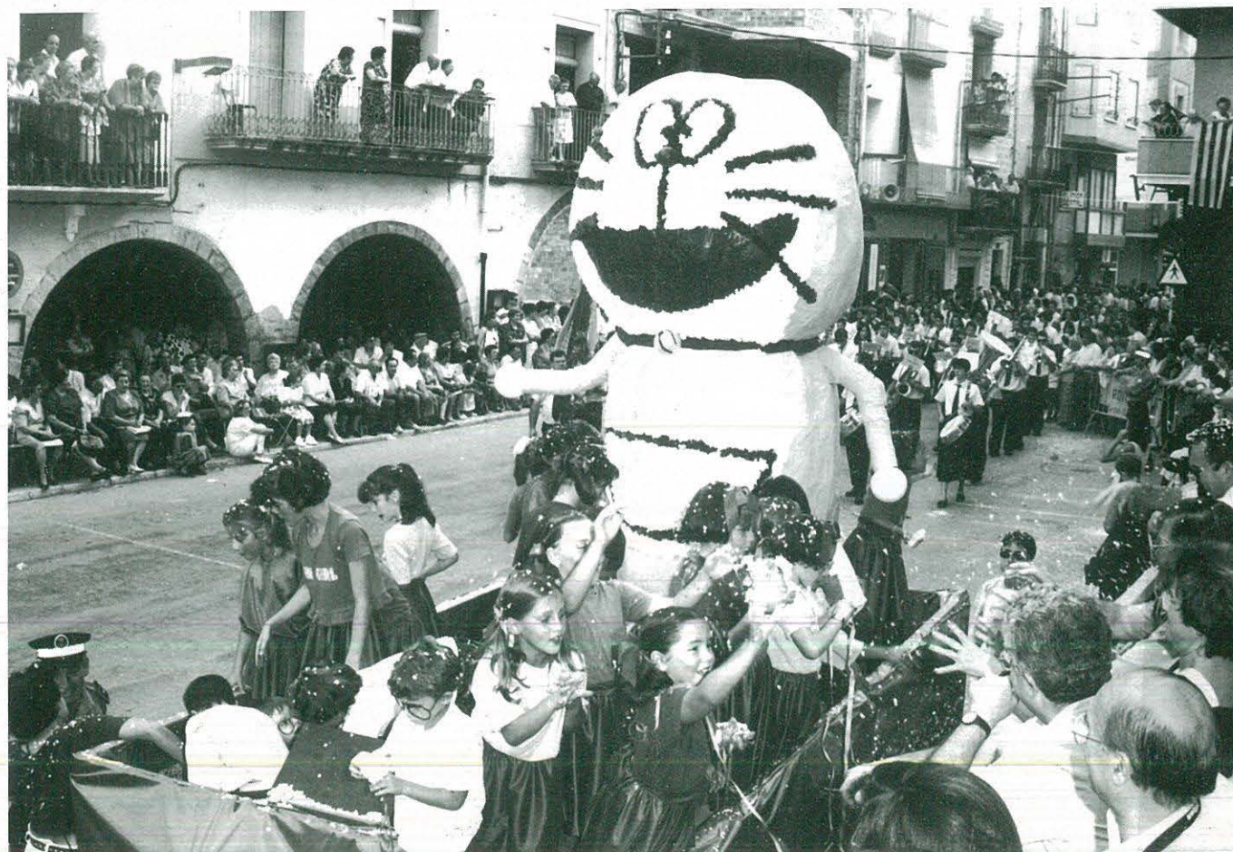
Doraemon, passejant pels carrers d'Ulldecona