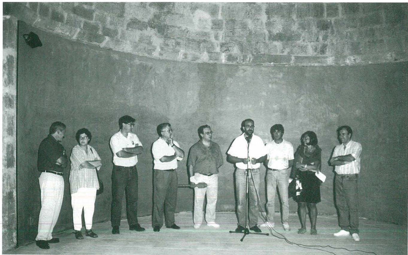
COMANADOR, AUTORITATS, REPRESENTANTS DEL C.C.R. I PERSONES QUE HAN DIRIGIT LA RECONSTRUCCIÓ I EXCAVACIÓ DEL CASTELL, PRESIDINT L'ACTE D'OBERTURA DE LA DIADA DEL CASTELL