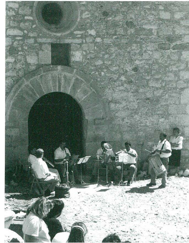
EL GRUP "ELS MINISTRILS DEL CASTELL" ENS VAN OFERIR UNES PECES DE MÚSICA MEDIEVAL