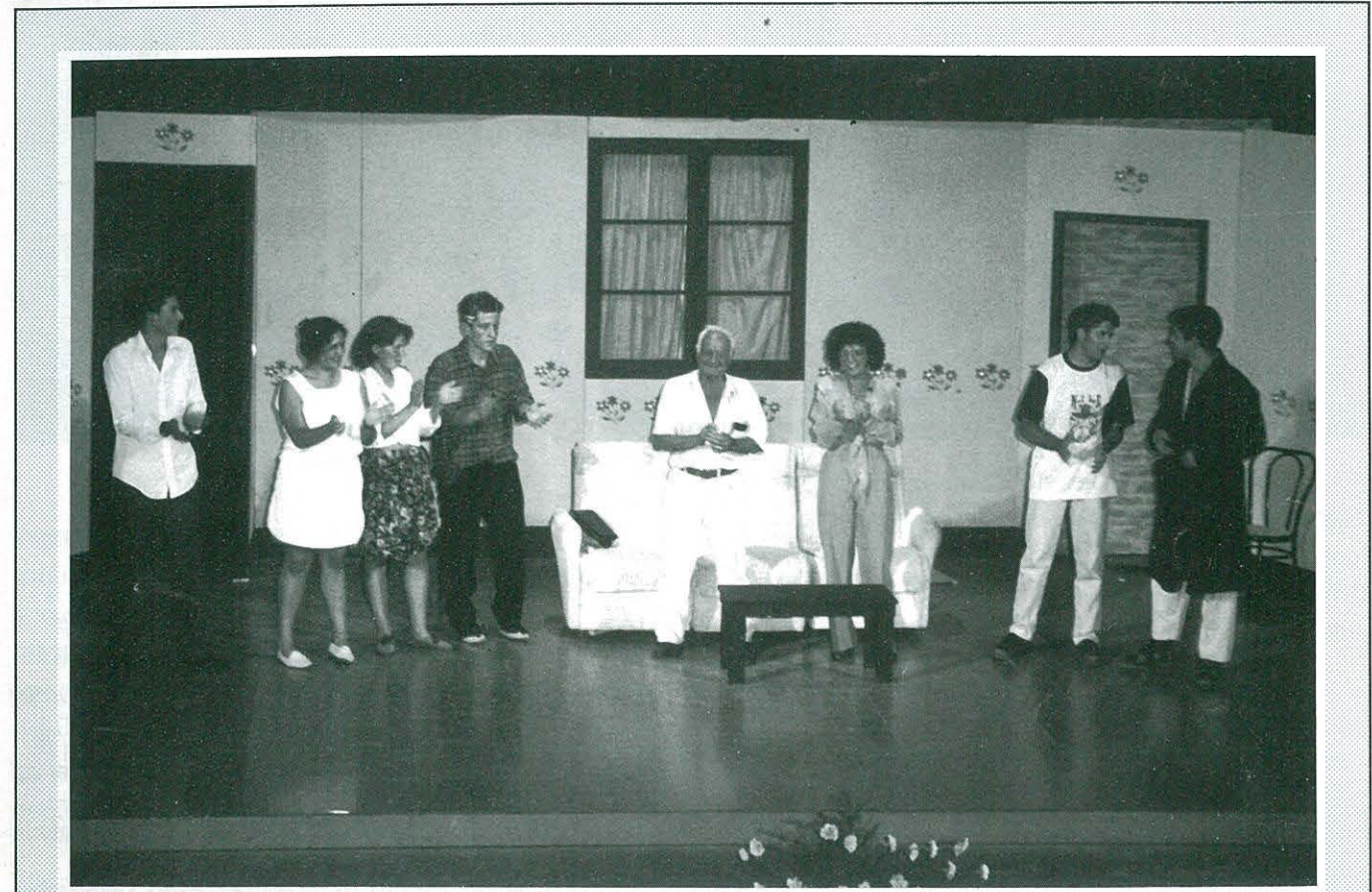
TEATRE JUVENIL - Representació del dia 10-9-95