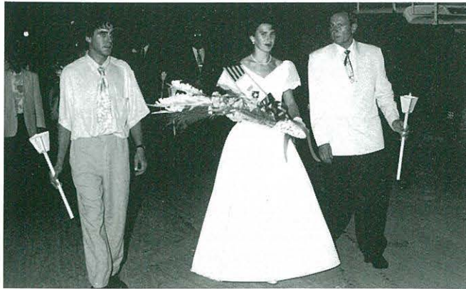
PUBILLA DEL C.C.R. i ACOMPANYANT, A LA PROCESSÓ