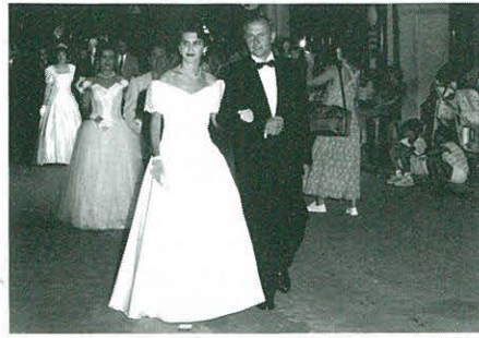
DIA DEL PREGÓ. PUBILLA I ACOMPANYANT DEL C.C.R.